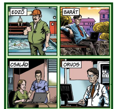
Egészségügyi adatok biztonságos megosztása