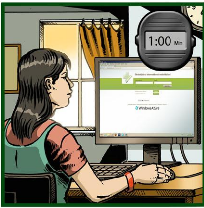
Ingyenes és gyors regisztráció